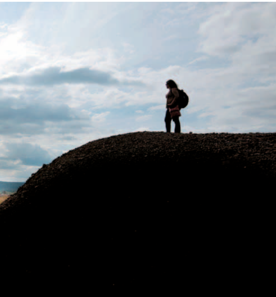
MALERISK: Fra toppen av slagghaugene er det noe uvirkelig og malerisk over utsikten.

kunstverk, men etter en times tid nede i gruvenes verden er det på tide å delta på kobbersmelting i neste rom.