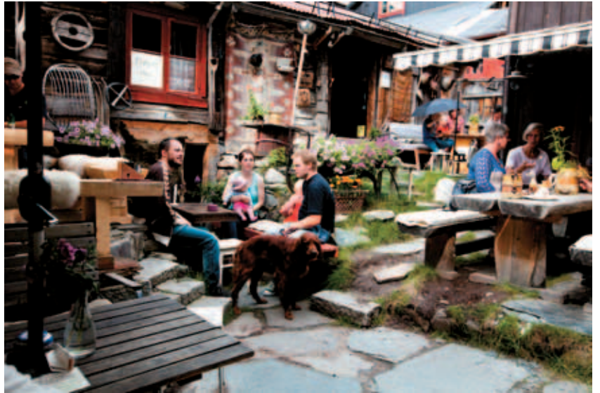
KOSELIG: Røros er ikke bare fortid, men har også et levende kulturliv og koselig kafekultur, som her på Frøyas hus.

Fjortisfnisingen fortsetter inne i butikken. Hvert kunstverk er dekorert med noe som ligner på sædceller. Eller er det bare fantasien